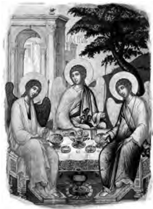
Sfânta Treime, icoană, Simon Ușakov, 1671

obiceiului lui Dumnezeu. În plus, lui Iisus Îi sunt atribuite calitățile pe care Dumnezeu le are și acțiunile pe care Dumnezeu le împlinește; de asemenea, Îi este adusă aceeași închinare care Îi este adusă lui Dumnezeu. O examinare detaliată a textelor Noului Testament privitoare la aceste subiecte i-a condus pe cercetătorii contemporani la următoarea concluzie: