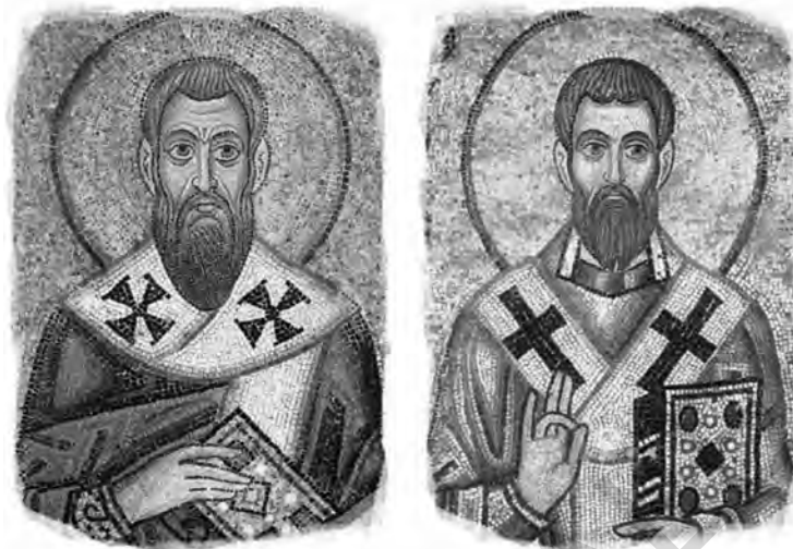
Sf. Vasile cel Mare și Sf. Grigorie de Nyssa, mozaic, sec. al XI-lea

La început era Cuvântul și Cuvântul era la Dumnezeu și Dumnezeu era Cuvântul. Acesta era întru început la Dumnezeu.