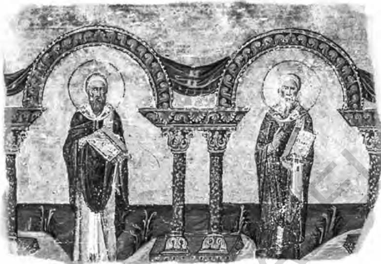
Sf. Atanasie și Chiril al Alexandriei, miniatură din Menologion -ul lui Vasile al II-lea, sec. al X-lea

Dumnezeu adevărat, născut (γεννηθέντα), nu făcut, deoființă 36 (ὁμοούσιον, consubstantialem ) cu Tatăl, prin Care toate s-au făcut, cele din cer și cele de pe pământ, Care pentru noi, oamenii, și pentru a noastră mântuire s-a pogorât [din cer] și s-a întrupat, făcându-se om, și a suferit și iarăși S-a ridicat a treia zi, S-a înălțat la Ceruri și iarăși va să vie să judece viii și morții;