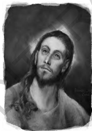
Capul lui Hristos, El Greco, 1580–1585

Ideile lui Strauss au fost popularizate în Franța de Ernest Renan (1823–1892), care a adoptat, de asemenea, o poziție strict raționalistă, pornind de la ideea că în viață nu există și nu poate exista nimic supranatural.