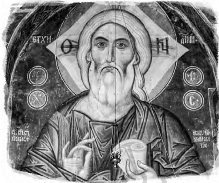
Cel Vechi de Zile, icoană, sec. al XVI-lea

trebuie ignorată legătura cu imaginea Fiului Omului din cartea lui Daniel. Fiul Omului despre care vorbește Iisus este departe de a fi un personaj convențional: El se află în cer (Ioan 3.13), Dumnezeu Tatăl își pune pecetea asupra Lui (Ioan 6.27), îngerii lui Dumnezeu urcă și coboară asupra Lui (Ioan 1.51). Fiul Omului a coborât din ceruri (Ioan 3.13) pentru a salva sufletele oamenilor (Luca 9.26). Pe pământ, El are puterea a ierta păcatele (Matei 9.6). Credincioșii trebuie să se împărtășească cu trupul și sângele Său pentru a avea viață în ei înșiși (Ioan 6.53). El va învia din morți (Marcu 9.9) și se va înălța la cer (Ioan 3.13), „acolo unde era mai înainte“ (Ioan 6.62). A doua Sa venire va fi pe neașteptate (Matei 24.44; 25.13), precum fulgerul care strălucește dintr-o parte a cerului, luminând până în cealaltă parte (Luca 17.24). El va veni în slava Tatălui Său cu sfinții îngeri (Marcu 8.38), va sta pe tronul slavei Sale și-i va așeza pe apostoli pe cele douăsprezece tronuri pentru a judeca cele douăsprezece seminții ale lui Israel (Matei 19.28); înaintea Lui se vor aduna toate neamurile, iar El „va despărți oile de capre“ (Matei 25.31–33).