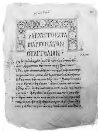
Manuscris grecesc al Evangheliei, sec. X–XI

Bauckham se întreabă „dacă tentativa de a reconstrui un Iisus istoric dincolo de Evangheliile [...] poate [spera] măcar să înlocuiască Evangheliile în [calitatea lor] de cale de acces la realitatea lui Iisus”. 58