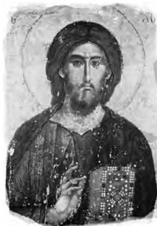
Hristos Pantocrator, icoană, sec. al XIII-lea

Cu toate acestea, nu putem ignora argumentele celor care pretind că Iisus nu a fost cine a spus Biserica și că, la origini, Biserica nu credea că Iisus este Dumnezeu. Au fost voci care au sugerat în mai multe feluri că, de-a lungul secolelor, Biserica a creat treptat o imagine a Fiului lui Dumnezeu pornind de la un simplu om – Iisus –, chiar dacă El a fost înzestrat cu daruri speciale și cu o înțelepciune deosebită. Până în ziua de azi, mulți savanți cred sincer că doar după multe secole de dezbateri legate de întrebarea „a fost Iisus Dumnezeu sau doar un simplu om?”, credința în natura divină a lui Iisus a căpătat influență în rândul ierarhiei ecleziastice, fiind apoi impusă întregii Biserici.