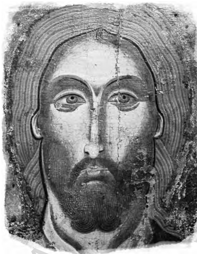
Mântuitorul, icoană, sec. al XIV-lea

Ne vom concentra atenția asupra trăsăturilor Sale de caracter și a modului în care L-a perceput lumea, precum și asupra mijloacelor Sale specifice de a comunica cu oamenii. Iisus nu este însă un om obișnuit: El este Dumnezeu întrupat, așa încât toate detaliile istoriei Sale umane au o legătură directă cu revelația transmisă de Dumnezeu oamenilor prin intermediul singurului Său Fiu. Trăsăturile Sale omenești sunt trăsături ale chipului divin; cuvântul Său uman este Cuvântul lui Dumnezeu adresat oamenilor. Aceasta este ceea ce conferă persoanei și învățaturii Sale o semnificație cu totul specială și exclusivă.