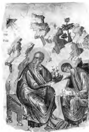
Sfântul Ioan Teologul și Prohor, miniatură, 1401

Dacă vorbim despre dovezile istoricității lui Iisus, atunci principala dovadă obiectivă sunt totuși sursele scrise, care provin, dacă nu de la Iisus însuși, atunci măcar de la cei mai apropiați ucenici ai Săi. Desigur, nici măcar un singur document scris de mâna Sa, și cu atât mai puțin de ucenicii Săi – autorii Evangheliilor –, n-a ajuns până