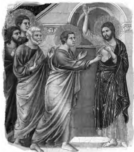
Toma necredinciosul, fragment din iconostasul Maestà al lui Duccio din Siena, 1311

Într-unul dintre episoadele finale ale acestei narațiuni, așa cum este prezentată în Evanghelia după Ioan, Sf. Ap. Toma – care nu fusese prezent atunci când Hristos cel înviat a apărut pentru prima oară – refuză să creadă în Învierea Sa. Opt zile mai târziu, Iisus apare din nou în fața unui grup de apostoli. De data aceasta, Toma se află printre ei. Iisus îi arată rănila de pe trup, spunându-i: „Nu fi necredincios, ci credincios“ (Ioan 20.27). Atunci Toma exclamă: „Domnul meu și Dumnezeuul meu!“ (Ioan 20.28).