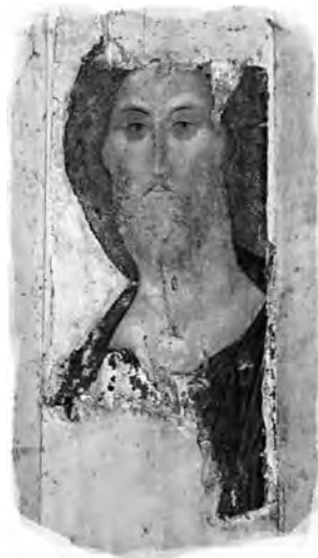
Hristos Mântuitorul, icoană, Sf. Andrei Rubliov 3 , anii 1420

Al doilea volum al seriei va fi dedicat Predicii de pe munte (Matei 5–7). Al treilea și al patrulea volum vor fi dedicate minunilor, respectiv pildelor lui Iisus. În cel de-al