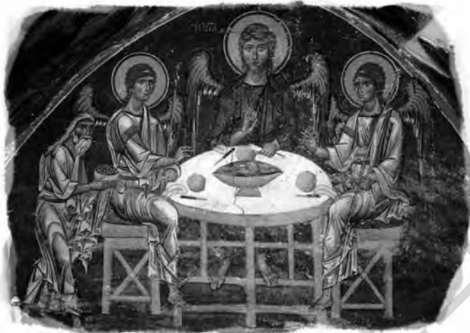
Sfânta Treime, frescă, anii 1176–1180

Cu toate acestea, Biserica s-a lepădat în mod constant de toți aceia care – într-un fel sau altul – au contestat natura divină a lui Iisus, declarându-i eretici și respingându-le învățăturile la Sinoade.