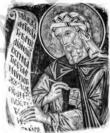
Sf. Cuvios Ioan Damaschin, frescă, sec. al XVI-lea

Învățătura care a negat categoric dumnezeirea lui Iisus, aducând o provocare serioasă creștinismului, a fost islamul. Apărut în secolul al VII-lea, acesta a început să se răspândească rapid; la început el a fost înțeles de creștini doar ca o altă erezie. Sf. Ioan Damaschin, un scriitor creștin din secolul al VIII-lea, a inclus islamul în lista ereziilor la numărul 101 38 . Sf. Ioan Damaschin a legat apariția islamului de arianism, care nega natura divină a lui Iisus (există și relatări care arată că învățătorul lui Muhammad a fost un călugăr nestorian). Oricum ar fi, Sf. Ioan Damaschin a considerat apariția islamului ca o nouă abatere de la puritatea dogmei creștine; abia mai târziu a devenit clar că islamul este o nouă religie, și nu un curent eretic în cadrul creștinismului.