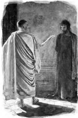
Ce este Adevărul? (Hristos și Pilat), Nikolai Ge, 1890