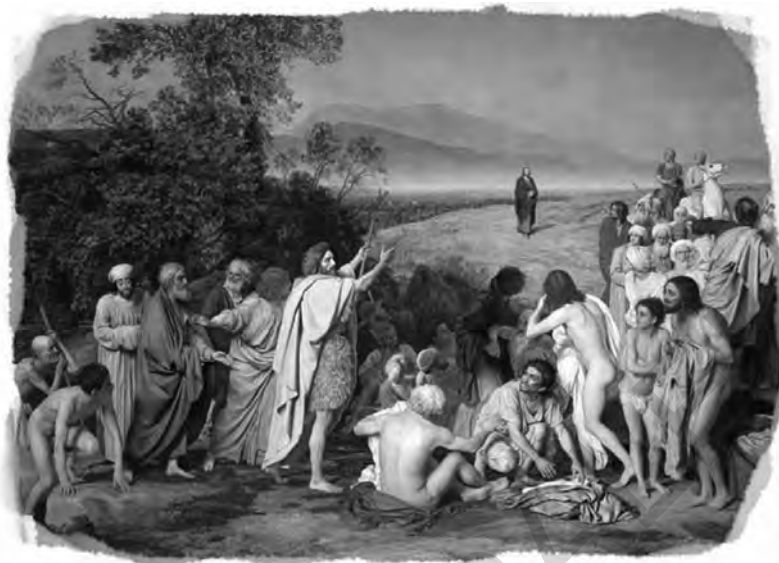
Hristos se arată înaintea poporului, Alexandru Ivanov, 1837–1857

Bultmann și alți cercetători care au folosit această metodă au pornit de la presupunerea că fiecare pasaj evanghelic a existat mult timp în tradiția orală și a fost transcris abia mai târziu, iar această transcriere a fost făcută cu un scop precis și într-un context definit, adică în conformitate cu necesitățile unei anumite comunități. Cu alte cuvinte, esențială nu este persoana lui Iisus sau învățătura Sa, ci comunitatea bisericească, în care unul sau mai mulți autori au modelat imaginea lui Hristos în funcție de așteptările membrilor acelei comunități. Pentru a reda imaginea istorică a lui Iisus era esențial, conform acestei metode, ca – înainte de a fi încărcată de tot felul de adăugiri – să fie scoase la lumină acele forme „pure“ care constituiau nucleul original al tradiției evanghelice 42 .