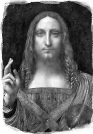
Salvator Mundi, Leonardo da Vinci, 1506–1513

O, oameni ai Cărții! Nu întreceți măsura în credința voastră! Nu spuneți despre Dumnezeu decât Adevărul! Da, Hristos, Iisus, fiul Mariei, este trimisul lui Dumnezeu, Cuvântul Lui pe care l-a aruncat Mariei, un Duh de la El. Credeți în Dumnezeu și în trimișii Săi! Nu mai spuneți: „Trei!“, sfârșiți cu aceasta, căci va fi mai bine pentru voi. Unul este Dumnezeu [Allah]! Mărire Lui! Cum să aibă un fiu? 39