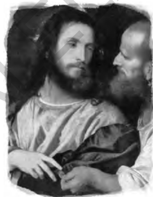
Banii pentru tribut, Tițian, circa 1516

Un alt strat al narațiunii evanghelice îl reprezintă interpretarea evenimentelor de către martorii oculari. În afară de prologul Evangheliei după Ioan și profețiile din Vechiul Testament din Evanghelia după Matei, anumite locuri și fraze izolate din Evangheliile aparțin categoriei interpretării, la fel ca și majoritatea epistolelor sobornicești, care aparțin martorilor oculari: unul dintre cei doisprezece apostoli. Stratul interpretativ este