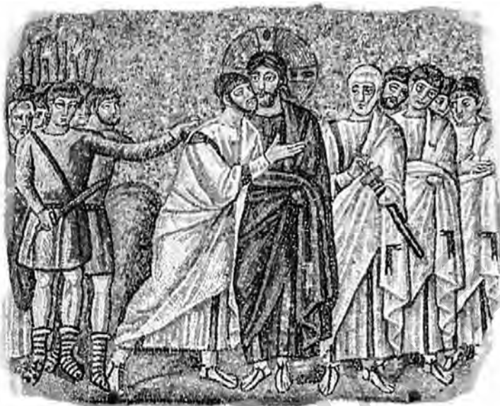
Patimile lui Hristos, mozaic, anii 530

a întreba cu ce drept se referă Bisericile creștine la acest Iisus Hristos care nu a existat niciodată, la doctrine pe care El nu le-a propovăduit, la puteri pe care nu le-a avut și la filiația divină pe care El însuși a considerat-o imposibilă și pe care nu și-a asumat-o“. 47