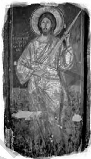
Hristos cu o sabie, frescă, sec. al XV-lea

În capitoul de față ne vom opri mai întâi asupra întrebării dacă Iisus a fost un personaj istoric real. Apoi vom vorbi despre autoritatea celor pe a căror mărturie se bazează informațiile despre Iisus și învățătura Sa. Apoi vom aduce dovezi despre natura Sa divină, așa cum au fost ele adunate și sistematizate de tradiția Bisericii. Capitolul se va încheia cu o scurtă trecere în revistă a căutării „personajului istoric Iisus”, pe care cercetătorii au întreprins-o în ultimele două secole.