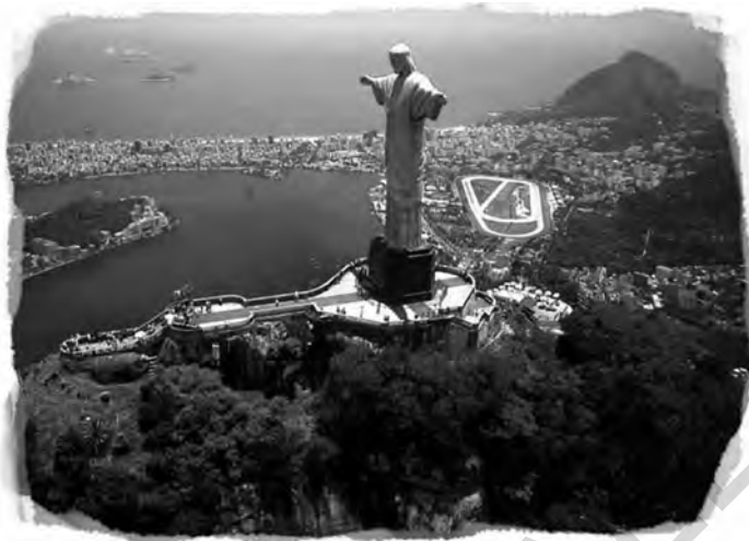
Statuia lui Hristos Mântuitorul, muntele Corcovado, Rio de Janeiro, Brazilia, 1922–1931

„descoperiri“ fantastice, bazate nu atât pe noi date științifice, cât pe interesele, gusturile, simpatiile sau antipatiile lor personale.