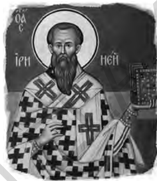
Sf. Irineu de Lyon, frescă, sec. al XVI-lea

În celebra sa rostire despre Sfânta Tradiție, Sf. Irineu de Lyon (sec. al II-lea) vorbește despre acest aspect: