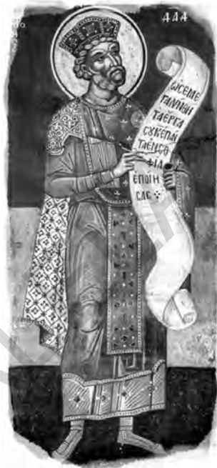
Regele David Psalmistul, frescă, sec. al XVI-lea

Cea mai clară afirmare a credinței Bisericii primare în dumnezeirea lui Iisus Hristos este prologul Evangheliei după Ioan, în care Iisus este identificat cu Cuvântul cel veșnic al lui Dumnezeu: