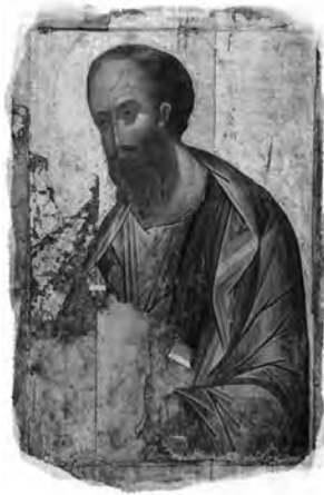
Sf. Ap. Pavel, icoană, Sf. Andrei Rubliov, circa 1410

la noi. Dar, chiar și în acele cazuri în care pare evident că autorul Evangheliei a scris textul (ca, de exemplu, în cazul Evangheliei după Luca, care începe cu un apel scris către cititorii săi), probabilitatea ca autograful 6 original să fi supraviețuit pentru un timp atât de lung este practic nulă.