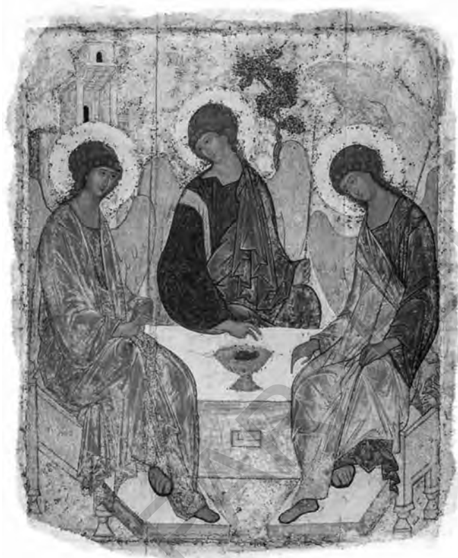
Sfânta Treime, icoană, Sf. Andrei Rubliov, anii 1420

Prologul Evangheliei după Ioan se încheie cu cuvintele: „Pe Dumnezeu nimeni nu L-a văzut vreodată; Fiul cel Unu-Născut, Care este în sânul Tatălui, Acela L-a făcut cunoscut” (Ioan 1.18). Edițiile critice moderne ale Noului Testament citează acest text într-o redactare ușor diferită: în loc de „Fiul cel Unu-Născut” ( monogenēs huios ), apare formula-rea „Dumnezeu cel Unu-Născut” ( monogenēs theos ). Această citire se bazează pe manuscrise mai vechi, în timp ce formula „Fiul cel Unu-Născut” este întâlnită doar în unele dintre manuscrise, începând cu secolul al IV-lea. Autenticitatea versiunii citate în edițiile critice este atestată de folosirea expresiei „Dumnezeu cel Unu-Născut” la autori din secolul al IV-lea, cum ar fi Sf. Vasile cel Mare 31 , Sf. Amfilohie de Iconium 32 și Sf. Grigorie de Nyssa 33 . Această expresie – „Dumnezeu cel Unu-Născut” – reprezintă încă o confirmare a credinței Bisericii primare în dumnezeirea lui Hristos și în faptul că venirea Sa pe pământ a fost chiar întruparea lui Dumnezeu.