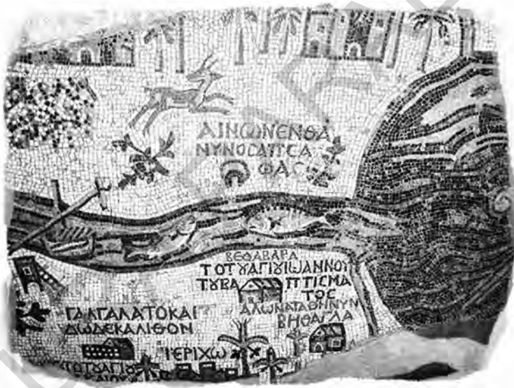
Harta Madaba: locul Botezului lui Hristos, mozaic, secolul al VI-lea

Ce avantaj au avut atenienii să-l omoare pe Socrate, a cărui răsplată au primit-o prin foamete și ciumă? Sau oamenii din Samos să-l ardă pe Pitagora, după care într-o oră țara lor a fost acoperită în întregime de nisip? Sau evreii prin moartea regelui lor înțelept, după care la scurt timp le-a fost luat regatul? Căci Dumnezeu a răsplătit cu dreptate înțelepciunea celor trei: atenienii au murit de foame; samienii au fost copleșiți fără șanse de apele mării; iar iudeii, părăsiți și izgoniți din regatul lor, risipindu-se prin toate țările. Socrate nu este mort, datorită lui Platon; nici Pitagora, datorită statuii Junonei; nici regele cel înțelept, datorită poruncilor pe care le-a dat. 16