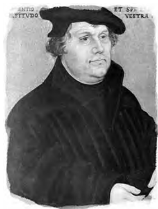
Martin Luther, Lucas Cranach cel Bătrân, 1543

De aceea, în comparație cu celelalte epistole, cea a Sf. Iacob este cu adevărat o epistolă de paie, pentru că nu are în ea nimic din natura Evangheliei. 40